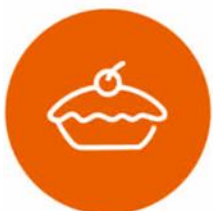
КОНДИТЕРСКИЕ И ХЛЕБОБУЛОЧНЫЕ ИЗДЕЛИЯ