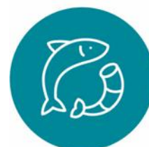
РЫБА И МОРЕПРОДУКТЫ