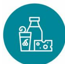
МОЛОЧНАЯ ПРОДУКЦИЯ И СЫРЫ