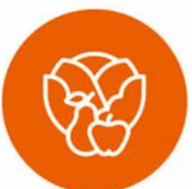
ФРУКТЫ И ОВОЩИ