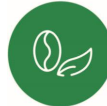
ЧАЙ И КОФЕ