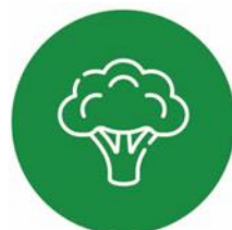
ЗДОРОВОЕ ПИТАНИЕ И ОРГАНИКА