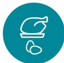
МЯСО, ПТИЦА И ЯЙЦА

Тематические разделы выставки охватывают все продуктовые категории, что позволяет закупщикам всего за 4 дня сформировать комплексную продуктовую матрицу, отвечающую самому актуальному потребительскому спросу.